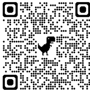
サッカー部専用 申込フォーム